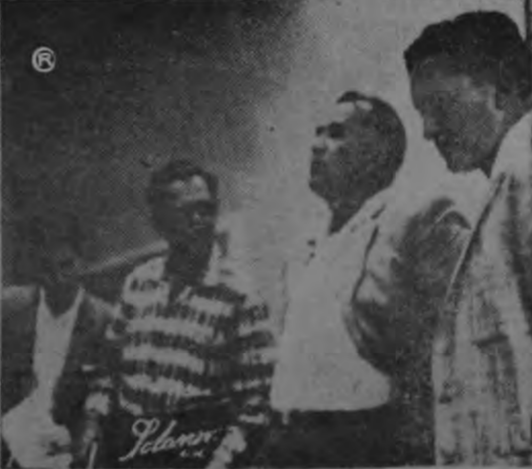
MUESTRA DOCUMENTOS el Director de la Guardia Civil. De izquierda a derecha Meoño de "Diario de Costa Rica", Zúñiga de LA REPUBLICA, el Coronel Ross y Villegas de ULTIMA NOTICIA.